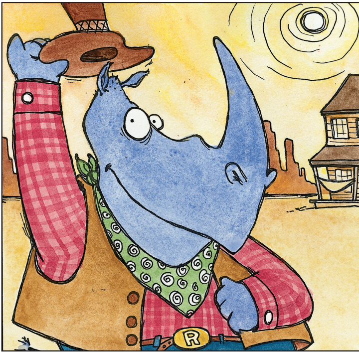
Rascal the Rhinoceros . . . Rascal el rinoceronte . . .