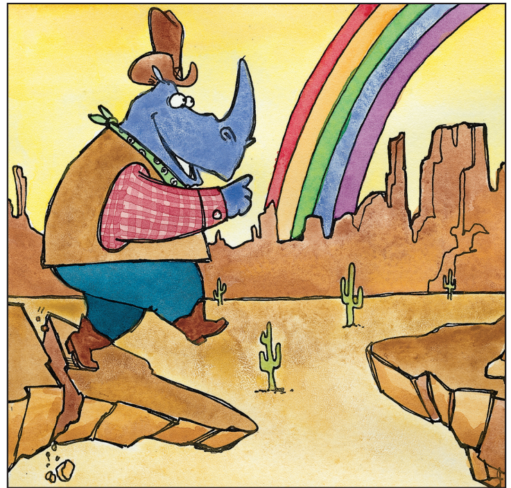
Sees a rainbow. Ve un arco iris.