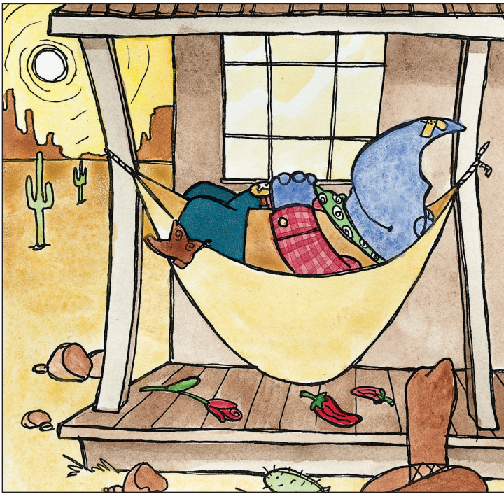
And rests at the ranch. Y descansa en el rancho.