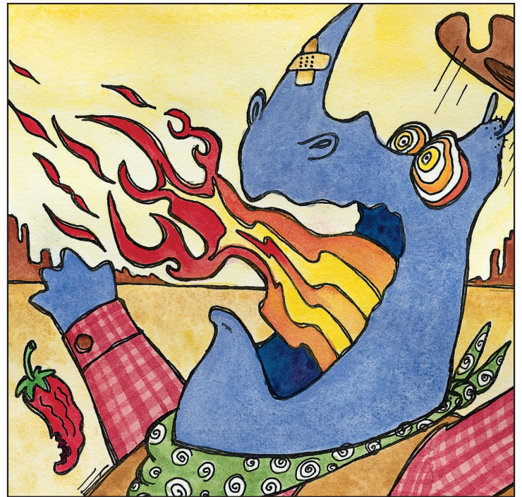
Tastes a red pepper. Prueba un chile rojo.