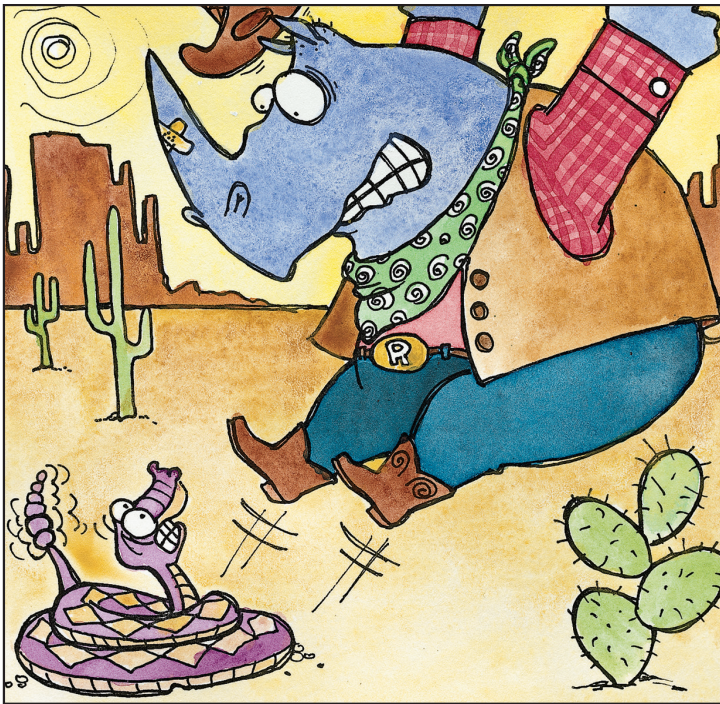
Hears a rattlesnake. Escucha una víbora de cascabel.