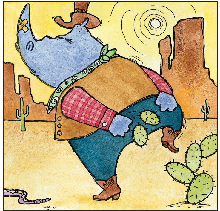
Rubs a rash. Se talla una erupción.