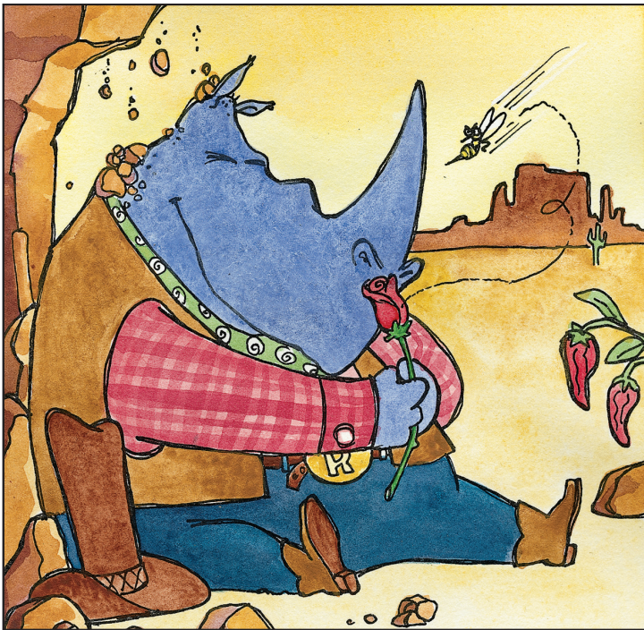
Smells a rose. Huele una rosa.