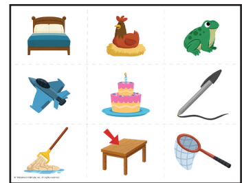
Ejemplo de las tarjetas de Sentido del Sonido