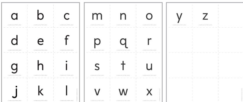
Tarjetas de letras minúsculas